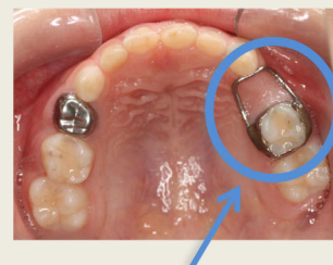
治療に用いた保険装置(一部保険適応)