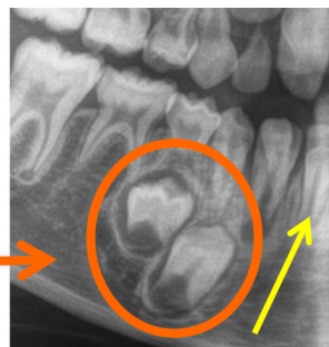
萌える方向を向いている(正常)