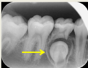
永久歯が乳歯の下で横を向いている(異常)このままでは萌えることが困難